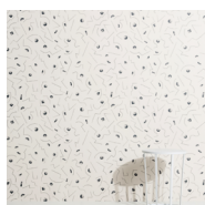
CONSTELLATION 2 Papier peint Wallpaper