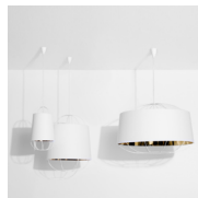
LANTERNA Suspension Pendant lamp