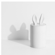
CURIOSITY Contenant Container