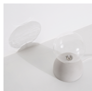
CAST Lampe à poser Table lamp