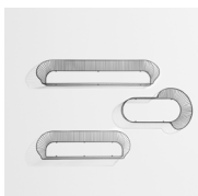
LOOP Étagère Shelf