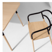
DOJO Table & chaise Table & chair