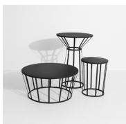
HOLLO Table Table